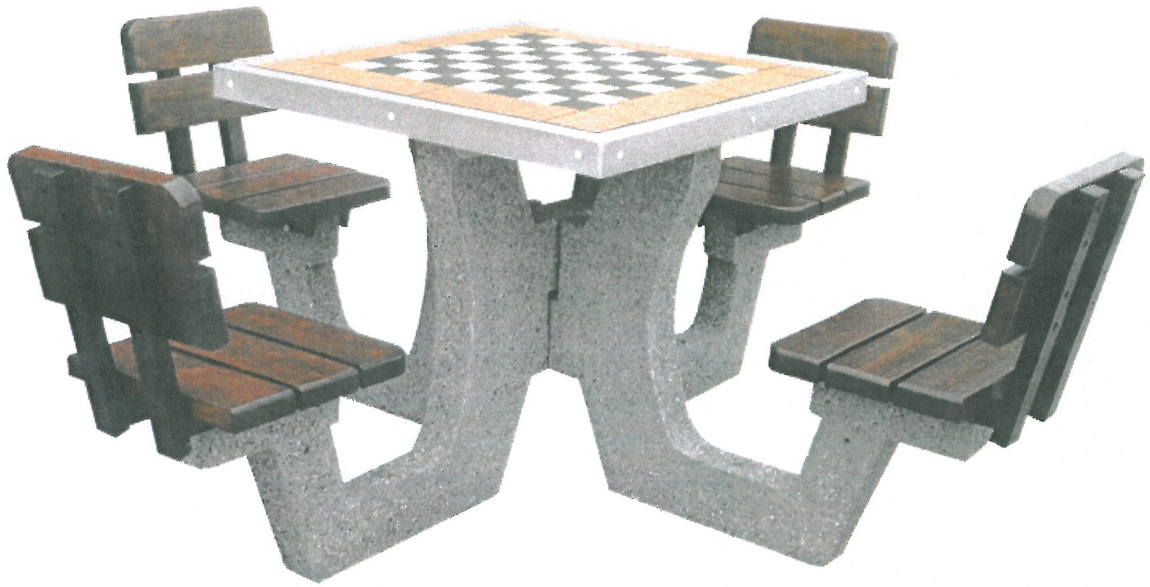
Betonowy stół do gry w szachy z oparciem