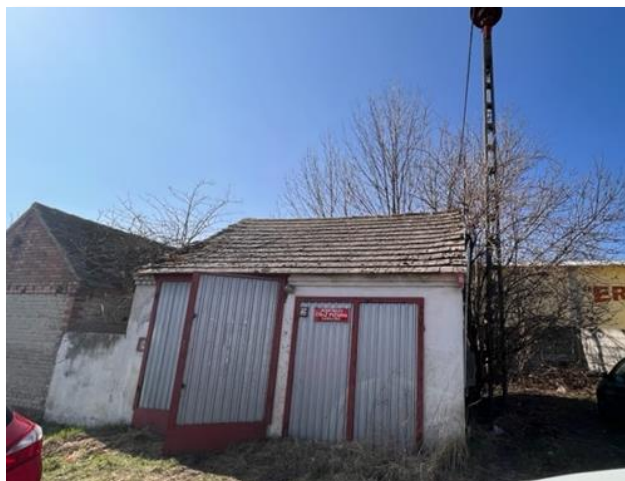
widok z przodu