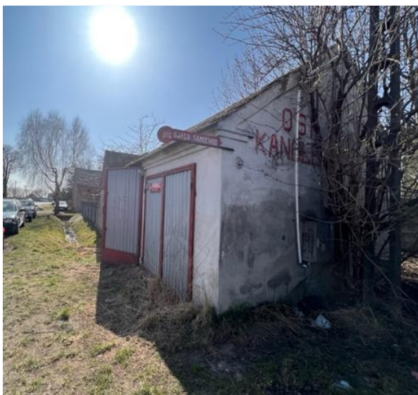
widok z boku

W pobliżu działki biegnie sieć wodociągowa.