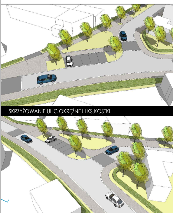
SKRZYŻOWANIE ULIC OKRĘŻNEJ I KS.KOSTKI

-66 MIEJSC PARKINGOWYCH -W TYM 4 MIEJSCA DLA NIEPEŁNOSPRAWNYCH