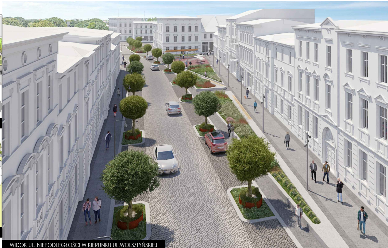
WIDOK UL. NIEPODLEGŁOŚCI W KIERUNKU UL.WOLSZTYŃSKIEJ