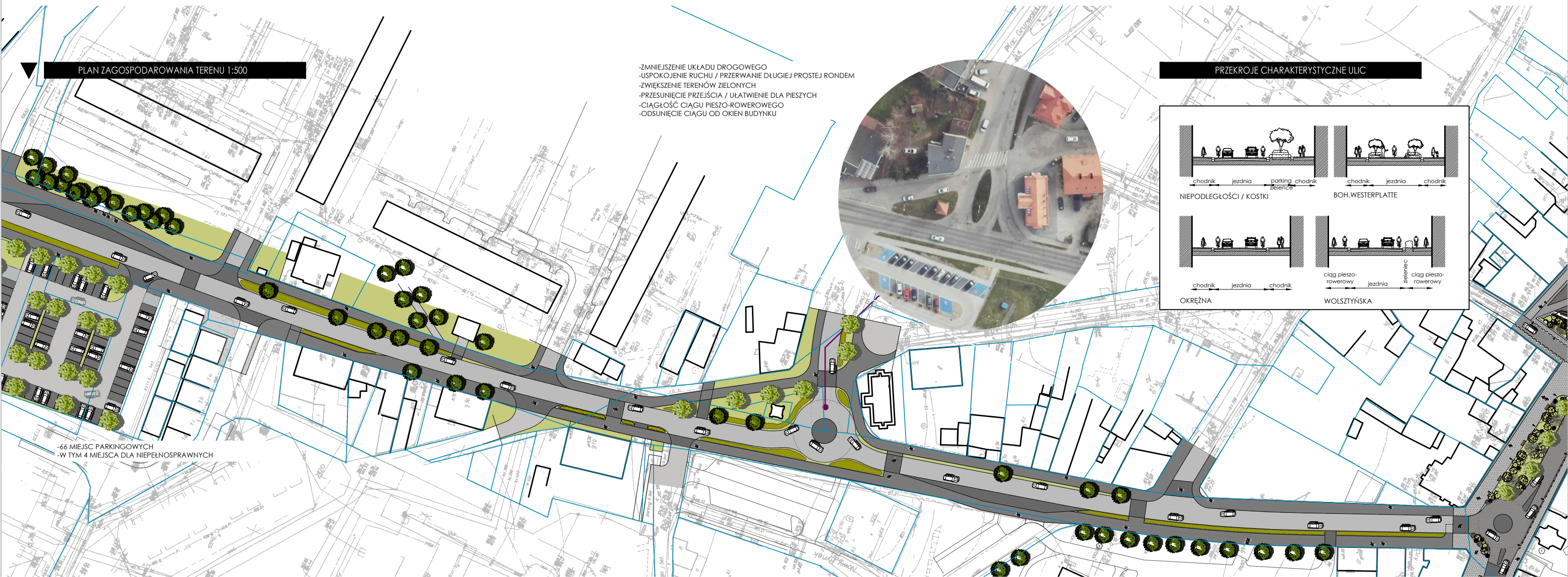
PLAN ZAGOSPODAROWANIA TERENU 1:500