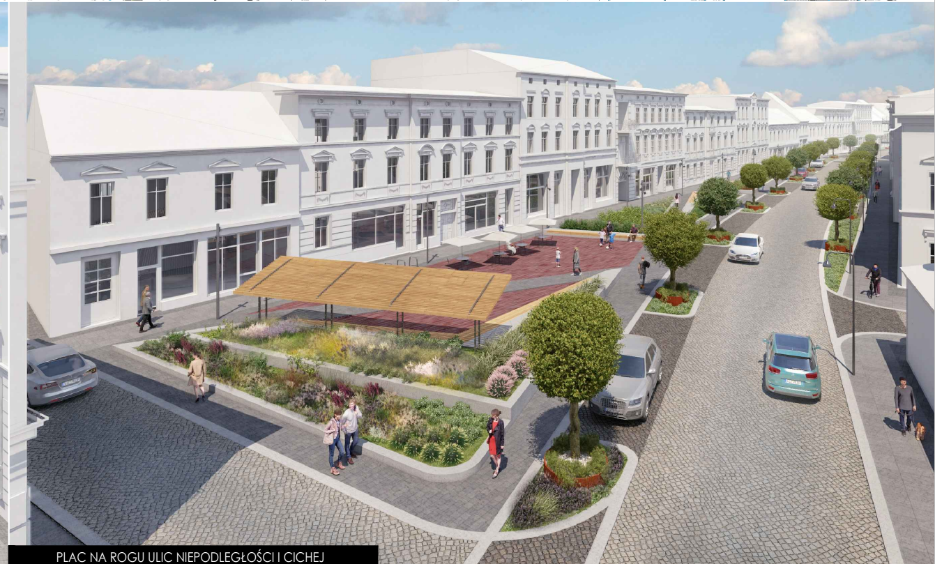
PLAC NA ROGU ULIC NIEPODLEGŁOŚCI I CICHEJ